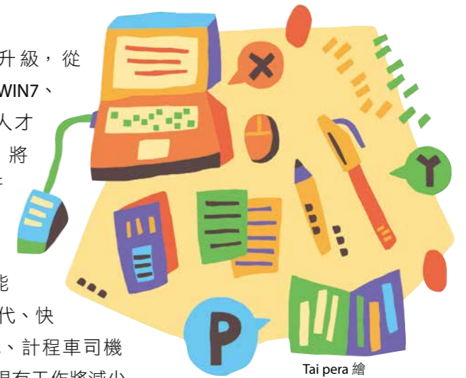
Tai pera 繪

以前升大學的大考，成績影響極大，但新課綱實施後，將有大改變；其中，「學習歷程檔案」是全新的設計，值得特別關注。108 學年度入學的高一新生，三年後將適用考招新制，新制的申請入學，採計項目包括新型學測