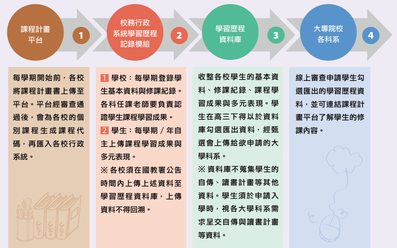
表 1 學習歷程檔案作業流程

李菁菁指出，國教署建置「高級中等教育階段學生學習歷程資料庫」，目的在完整記錄學生在學期間的學習軌跡。收整的資料內容，除了學生的學業表現，亦包含非學業上的成果表現，以補強考試無法呈現的學習成果。蒐