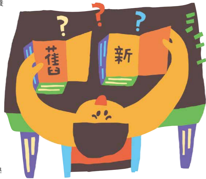
Tai pera 繪

核心素養非常強調「情境化」的學習方式，從生活中的問題或任務切入。楊俊鴻以「假新聞」