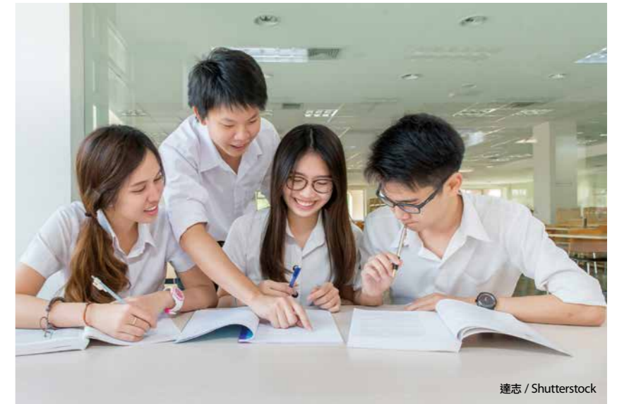
學生選擇學校時，可以先透過平台了解各校課程特色，適性選讀。

李菁菁補充，新課綱實施後，各高中都會設置「課程諮詢教師」。課程諮詢教師由各校遴選現職教師擔任，必須先受過相關知能培訓。在學期選課前，會向學生、家長說明學校有哪些選修